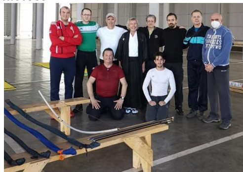
Quelques-uns des stagiaires

L'invitation à s'initier au Kyudo n'a pas été limitée qu'aux membres de la fédération serbe de tir à l'arc, ni aux habitants de Belgrade. Divers associations ayant des liens avec les arts martiaux et l'Asie ont été contactées.