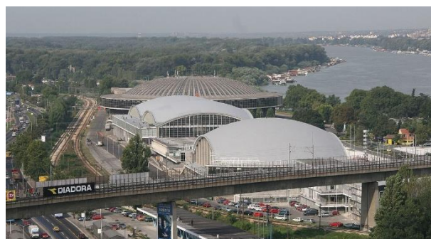
Centre d'exposition de Belgrade

Ont été construits 6 supports de Makiwara en bois.