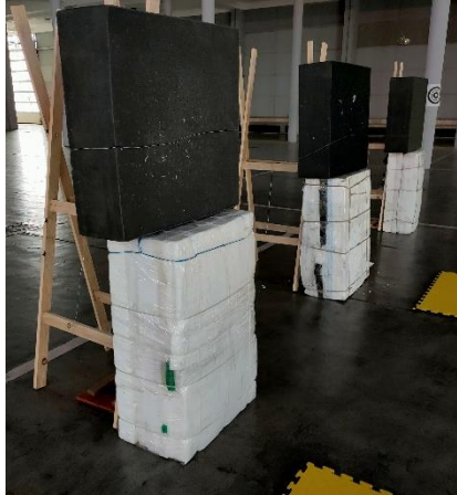
Version utilisée des "Makiwara"

Six rouleaux de carton et 6 boudins de natation ont été achetés pour construire les Makiwara. Comme les rouleaux de carton étaient très petits, nous avons tenté de fabriquer 3 Makiwaras avec les 6 rouleaux de carton, mais c'était encore trop petit; la solution illustrée ci-dessous a finalement été trouvée et s'est révélée très satisfaisante.